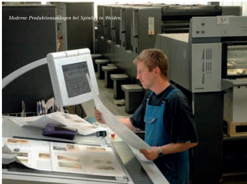
Moderne Produktionsanlagen bei Spintler in Weiden.

Da die betrieblichen Raumverhältnisse zu eng geworden waren, wurde im Jahr 1971 ein eigenes Druck- und Verlagshaus errichtet. 1991 fasste die Firma zusätzlich in Ostdeutschland Fuß und gründete ein Tochterunternehmen in der Nähe von Chemnitz, um