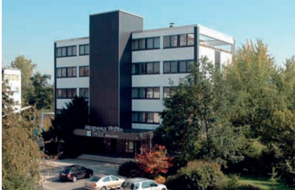
Das Medienhaus Weiden, der Firmensitz der Spintler-Gruppe.

Christian Omonsky, PR+Werbung Ludwig Faust