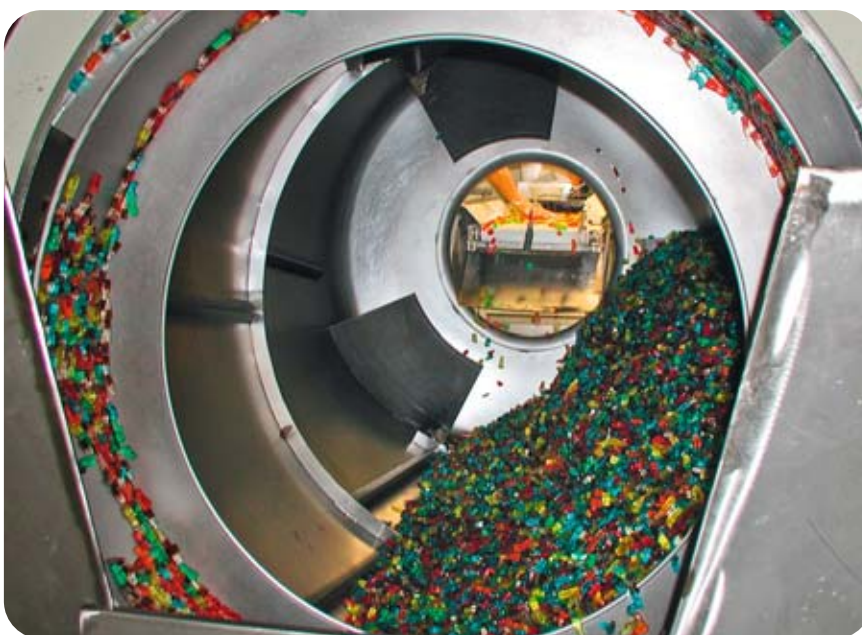
Für die Optik und damit sie nicht kleben werden die Fruchtgummis zum Schluss dünn mit Pflanzenöl überzogen.

Wichtigste Grundingredienzien der Fruchtgummis sind Zucker, Glukosesirup