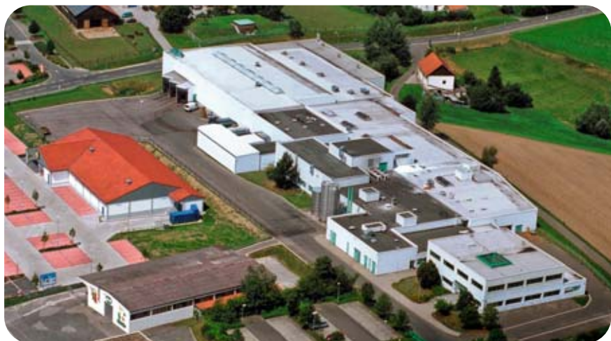
1989 verlagerte die Efruti GmbH & Co. KG ihre Produktion von Neutraubling nach Neunburg vorm Wald.

Die enorme Produktvielfalt des Herstellers entsteht nicht zuletzt durch Klein- und Kleinstaufträge zum Beispiel für die Werbung. „Mindestens fünf Tonnen sollte der Auftrag aber schon umfassen, sonst lohnt sich der Aufwand nicht“, meint der Vertriebsleiter. Auf Kundenwunsch entwerfen die Neunburger nicht nur individuelle Formen, sondern auch spezielle Rezepturen. „In Mode ist derzeit Aloe Vera.“ Im Labor entstehen dann erste Handmuster, die der Kunde auf Form, Farbe und Aroma testen kann. Zwei oder drei Umläufe später ist der Aloe-Vera-Fruchtgummi dann fertig, um auf der Maschine umgesetzt zu werden.